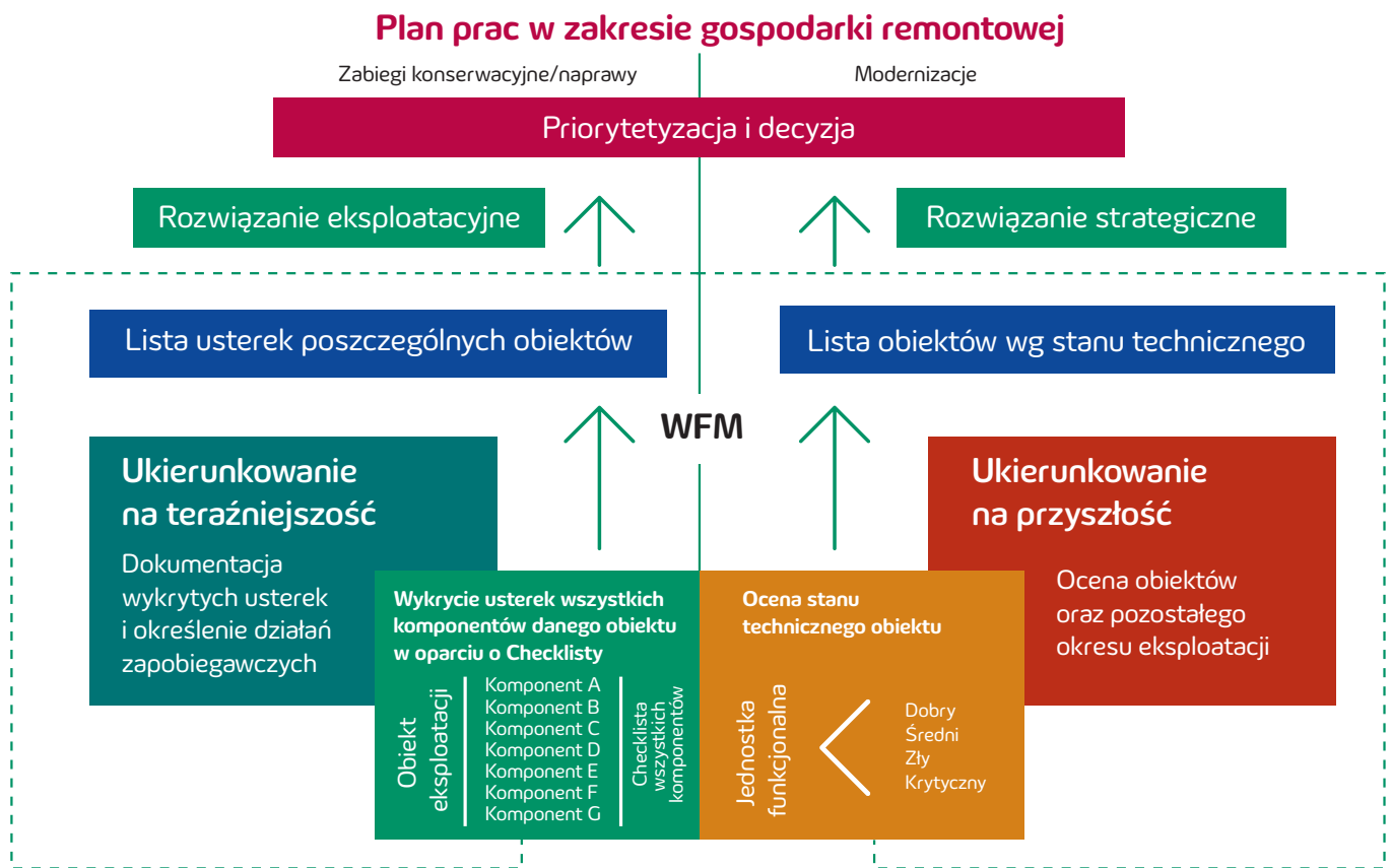
Rysunek 2. Wykorzystanie narzędzia WFM oraz wyników oceny stanu technicznego do planowania prac w zakresie gospodarki remontowej innogy Stoen Operator

Na podstawie wykazu usterek określone są działania zapobiegawcze, natomiast lista obiektów wg stanu technicznego uwzględniana jest przy podejmowaniu decyzji strategicznych odnośnie do planu prac remontowych, co zilustrowano na rysunku 2.